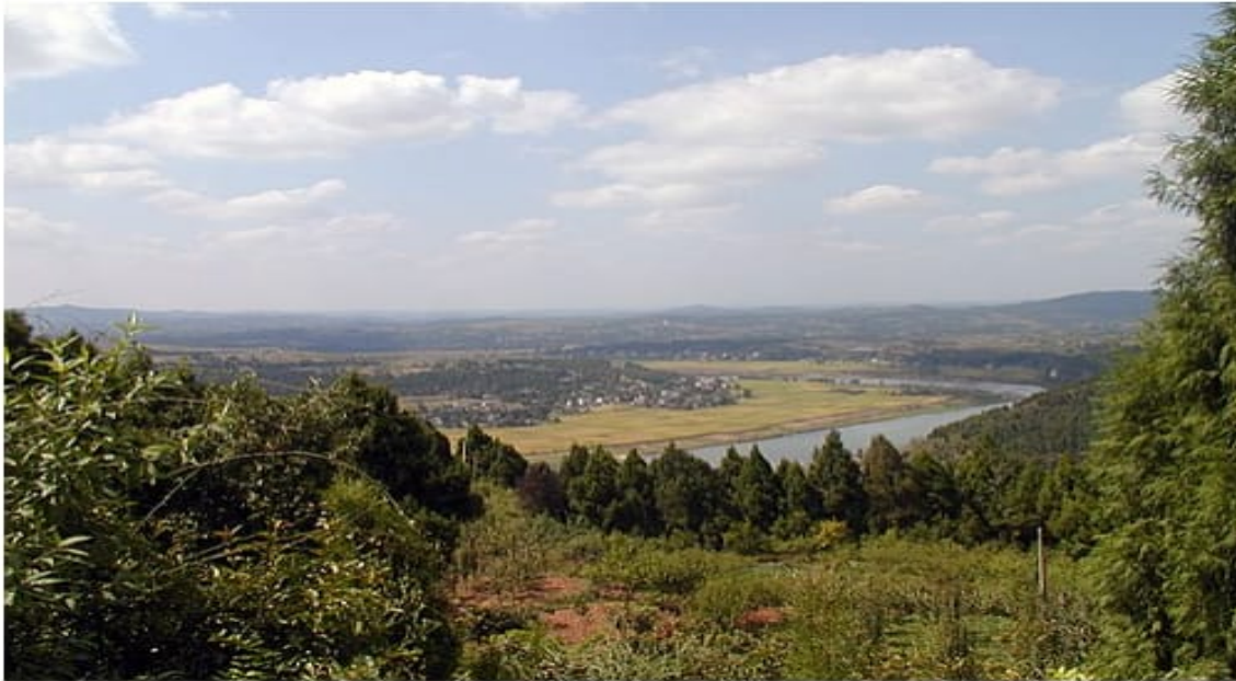
Sichuan Basin landscape in Zitong County